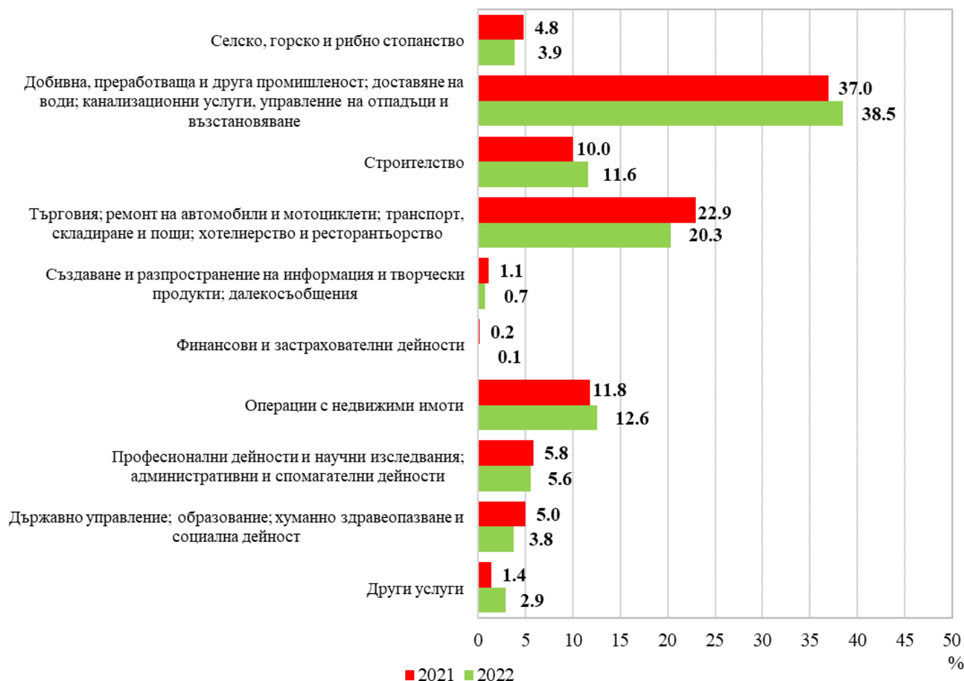
Фиг. 2. Структура на разходите за придобиване на дълготрайни материални активи през 2021 и 2022 г. по икономически дейности

Най-голям обем инвестиции в ДМА са вложени в промишления сектор - 1 128 млн. лв., и в сектора на услугите (търговия, ремонт на автомобили и мотоциклети, транспорт, складиране и пощи, хотелиерство и ресторантьорство) - 594 млн. лева. През 2022 г. тези сектори заедно формират 58.8% от общия обем разходи за ДМА, а относителният им дял общо намалява с 1.1 пункта спрямо предходната година. В сектор „Операции с недвижими имоти” инвестициите в ДМА достигат 367 млн. лева, или с 38.0% повече в сравнение с 2021 година.